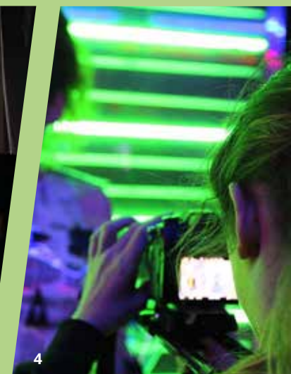
IN FOTO: Progetto realizzato dal dipartimento di Scenografia - Cinema e audiovisivo.