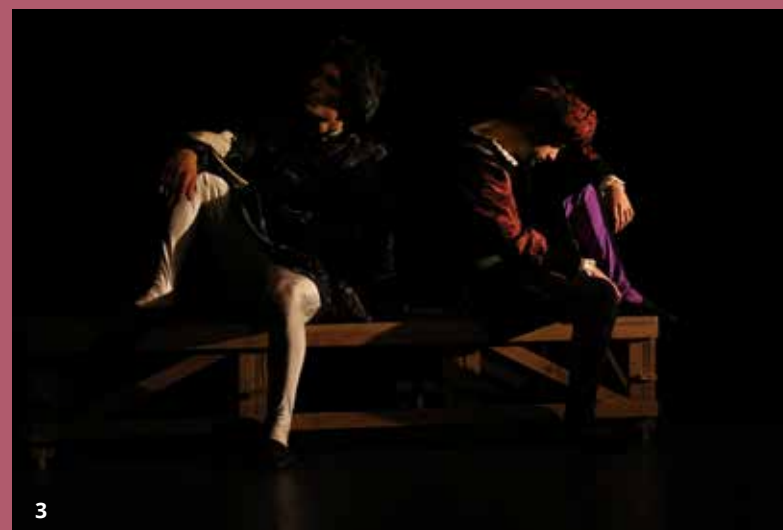
IN FOTO: 1 - 2 - 3 Progetti realizzati dal dipartimento di Scenografia