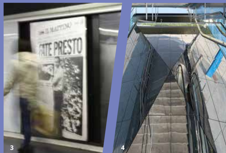
IN FOTO: 1- Camilla Viadana; 2 - Ilaria Grippa; 3 - Chiara Iadicicco; 4 - Ilario Piatti;