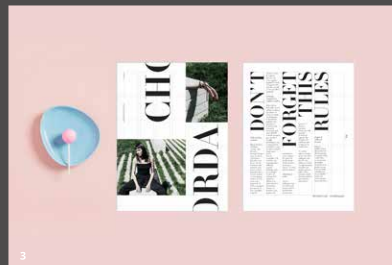
IN FOTO: 1- Paolo Finazzi; 2 - Luca Giardinetto; 3 - Laura Landri;